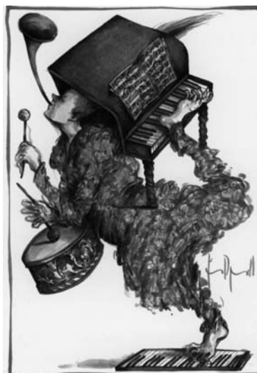
Bis der erste kühle Nebel zieh

In meinem CD-Player (Gibt es dafür eigentlich kein deutsches Wort? Kompakt-Platten-Abspielgerät klingt jedenfalls ziemlich