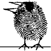
Grafik: Goly Münchrath