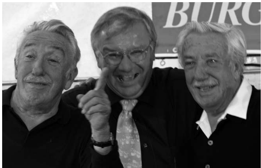
Der Staatssekretär gratuliert