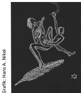
Grafik: Hans A. Nickel

Seinen Neustart unternahm Nickel mit einem erneuten Studium samt Promotion zum Doktor der Philosophie im Jahr 1983. Dann verschrieb er sich seinem alten Traum: der Bildhauerei, dem Malen und Zeichnen. Von all seinen Lebensdaten –