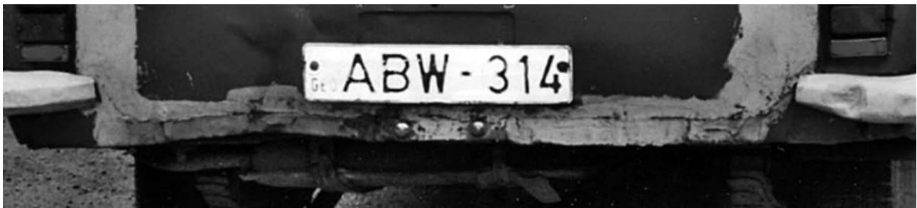
In Georgien gefunden von Swobl: Auto-Nummernschild

17. Mai 2008, Sohren/Hunsrück: 10. Int. Folk Festival „Highland Games“ siehe www.hunsrueck-highlander.de