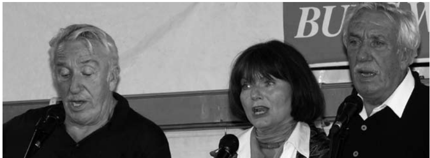
Falado, oh Falado...

Granatsplitter verfehlten die Wirbelsäule nur um Zentimeter. Zufall und Verwegenheit brachten ihn schließlich in englische und nicht in russische Gefangenschaft. Er dolmetschte, arbeitete als Steward, hörte schottische Dudelsackspieler. Es ist ja die Ironie dieses jungen Liederlebens, dass der Soldat, der